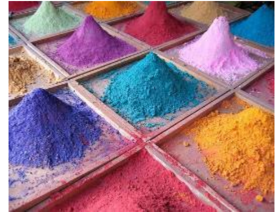
Minerale pigmenten en ijzeroxiden (Europa)