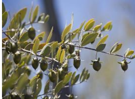
Jojoba-olie (Noord- Amerika)