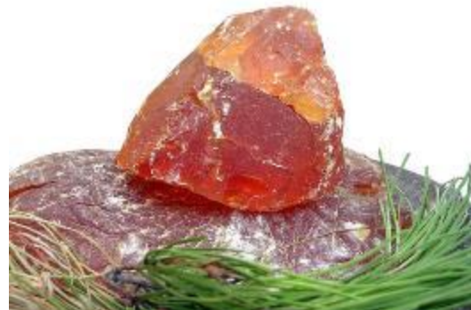
Natuurlijk colofonium (Europa)