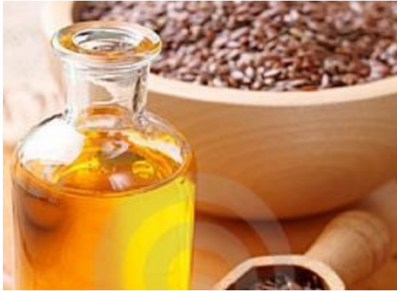
Standolie van lijnolie (Europa)