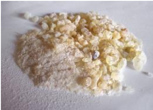
Plantaardige Dammar- hars (Azië)