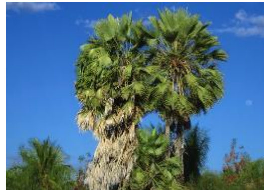
Carnaubawas (Zuid- Amerika)